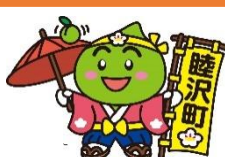
睦沢町 うめ丸くん